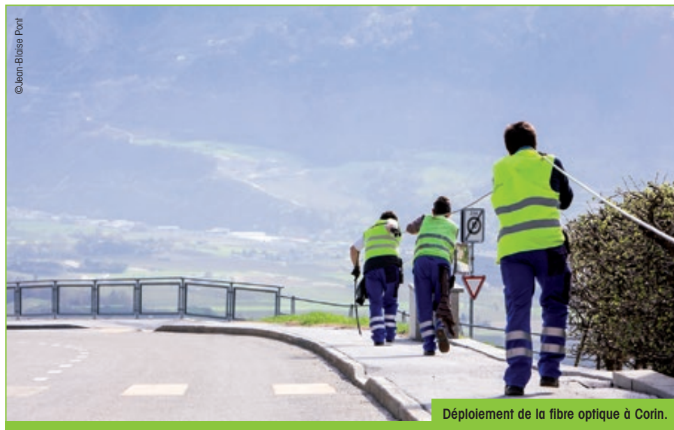
Déploiement de la fibre optique à Corin.